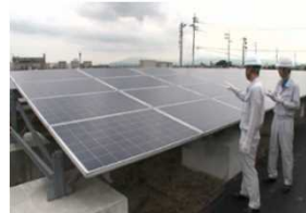
太陽光パネルの外観検査

使用済みとなった太陽光パネルについても、再販売可能なものもある。既に多くのリユース事例が報告されている。