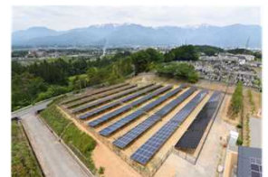
リユース品を使用した発電所