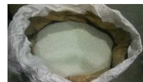
破碎・選別したガラス