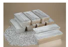
有用金属（銀）のイメージ