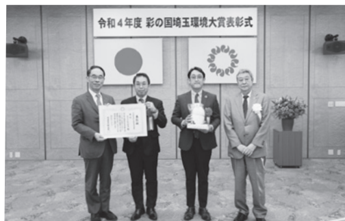
事業者部門 大賞受賞 株式会社 CRS 埼玉