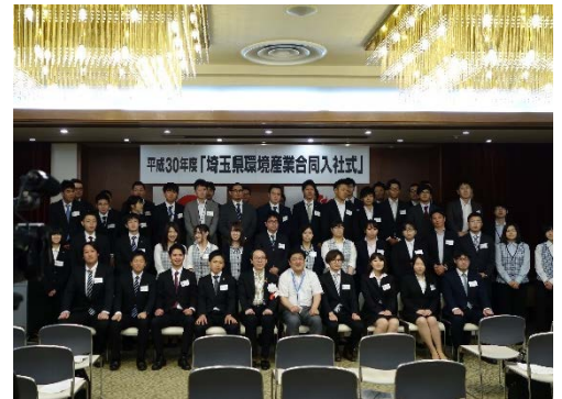
平成30年度入社式の様子